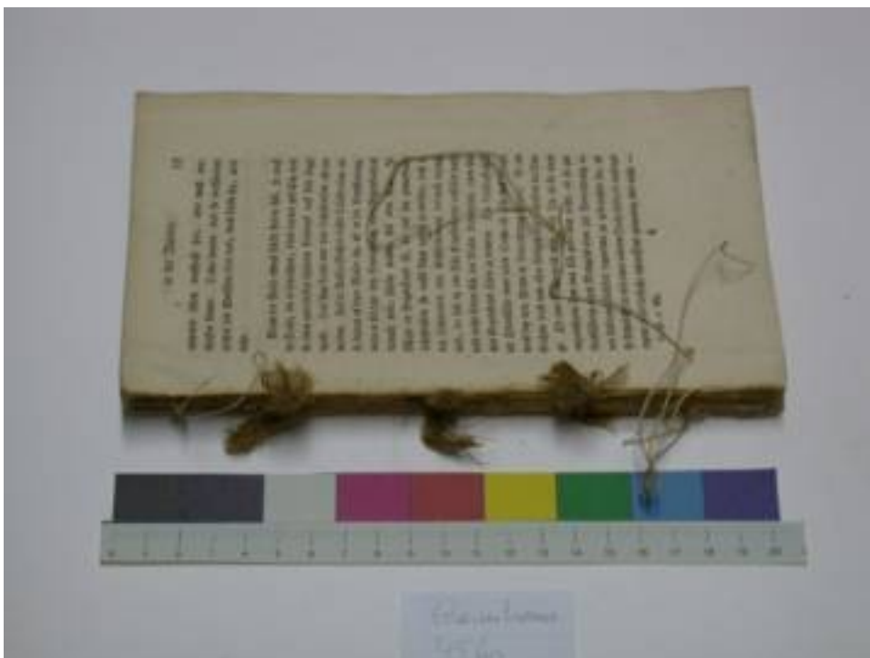
Foto 6: Restaurierung; Buchblock mit originalen Heffelementen (drei Hanfbünde und Heffäden)