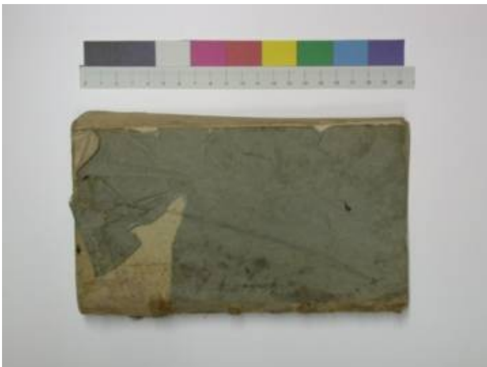
Foto 1: Objekt vor der Restaurierung; mechanische Schäden am Einbandpapier (Risse und Knicke), Oberflächenverschmutzung und Flecke