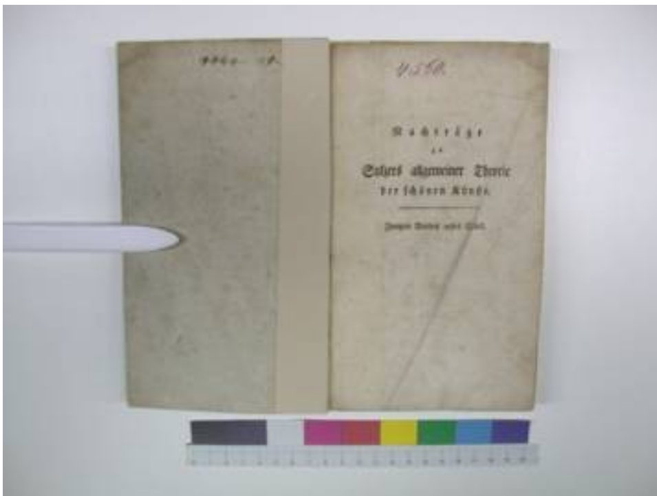
Foto 7: nach der Restaurierung; Spiegel und Titel (gereinigt und stabilisiert)