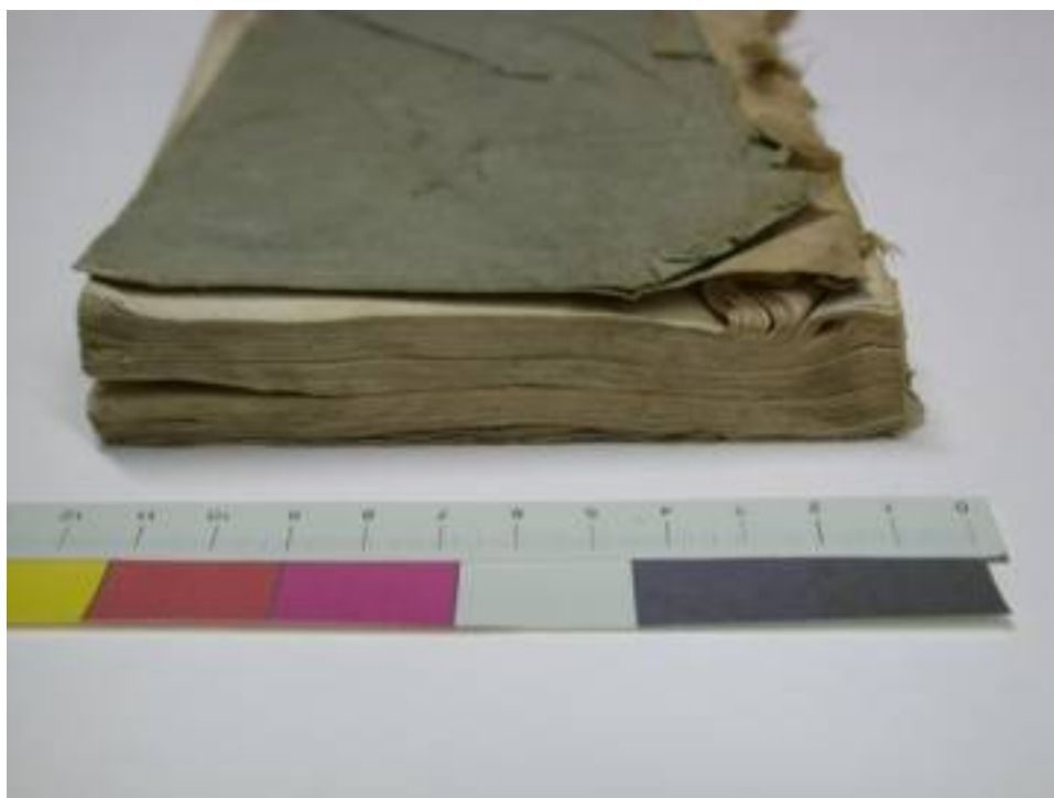
Foto 4: Objekt vor der Restaurierung; mechanische Beschädigungen am Einband und instabile Heftung