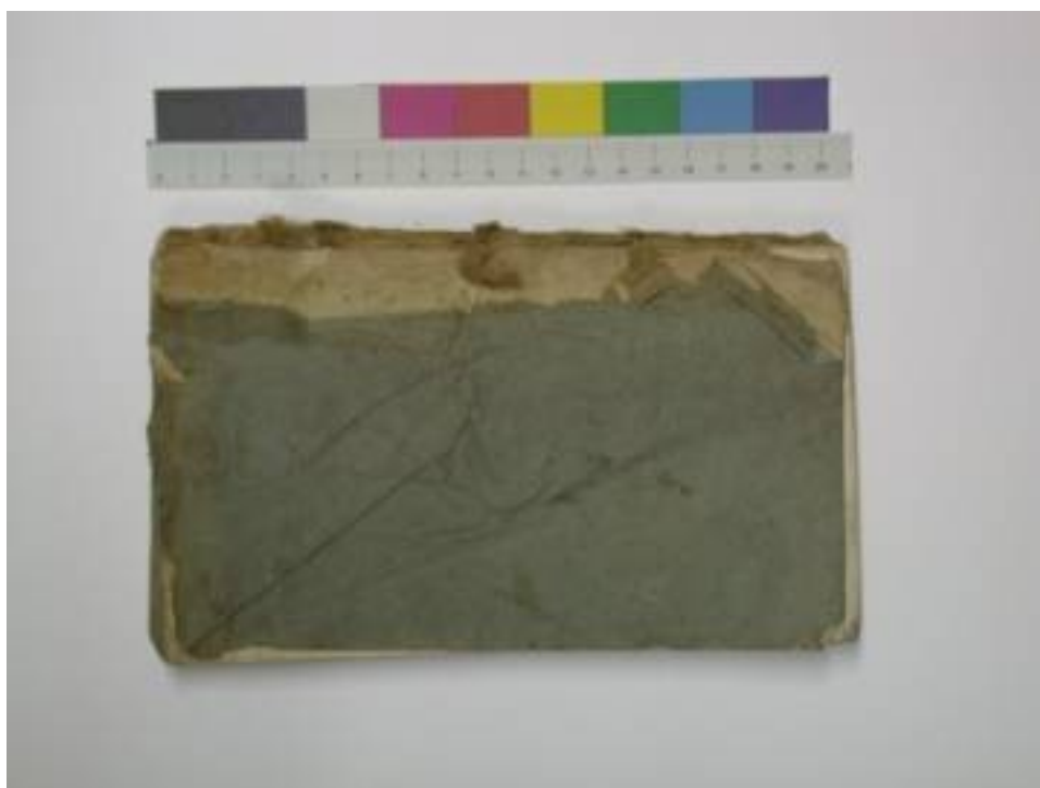
Foto 2: Objekt vor der Restaurierung; mechanische Schäden am Einbandpapier (Risse und Knicke), Oberflächenverschmutzung und Flecke