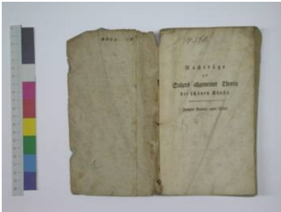
Foto 3: Objekt vor der Restaurierung; Spiegel und Titelblatt, mechanische Beschädigungen am Einband und instabile Heftung