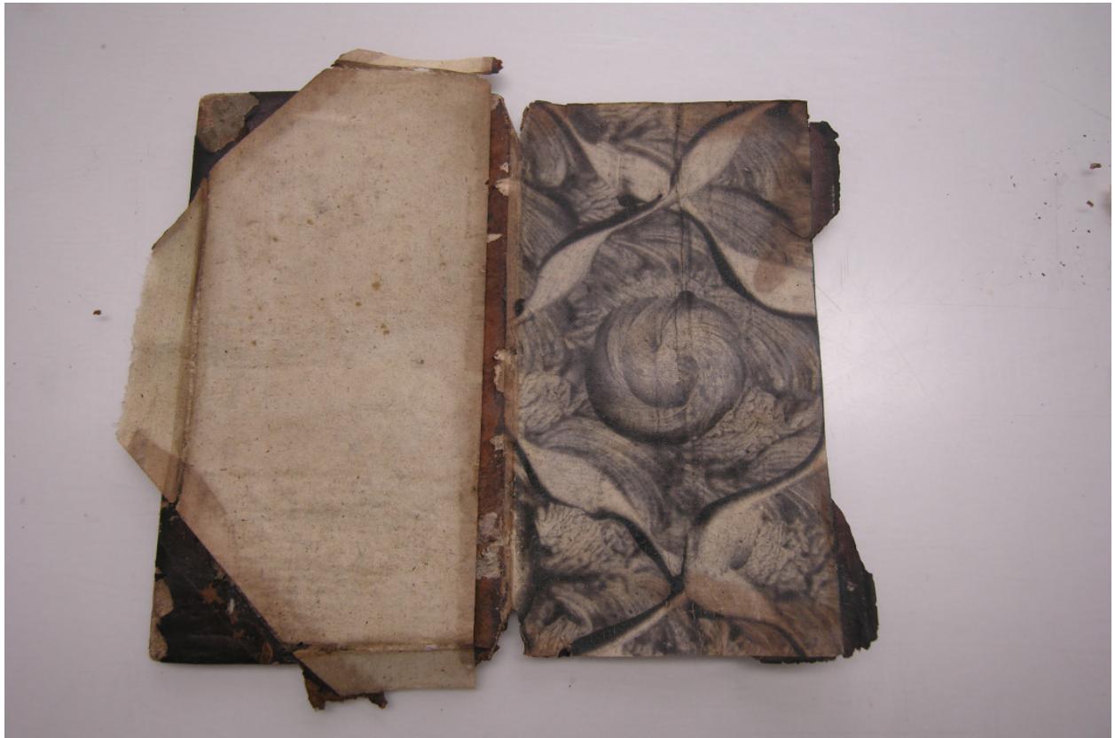
Foto 5: Objekt bei der Restaurierung – Ablösen Einband Papiere und Spiegel