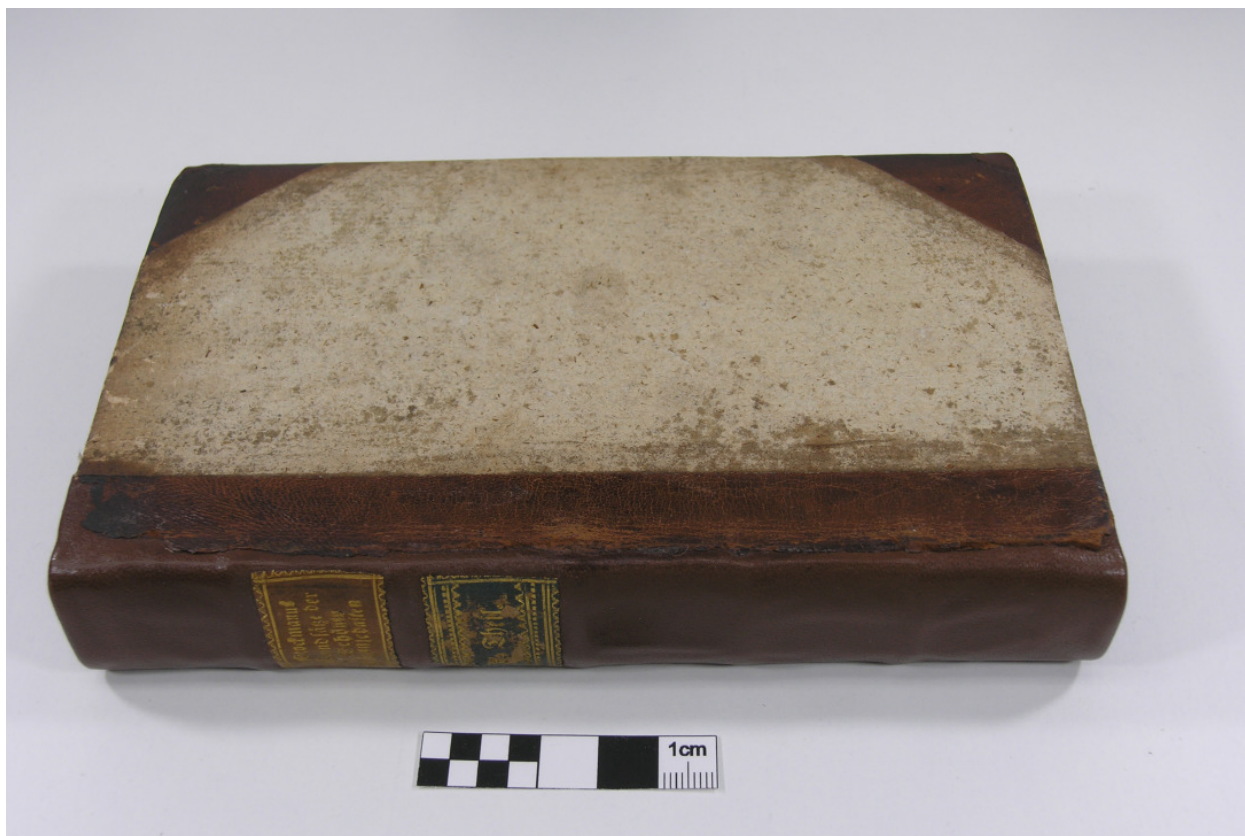
Foto 2: Objekt nach der Restaurierung – vorderer Deckel, Rücken Titelschilder aufgebracht