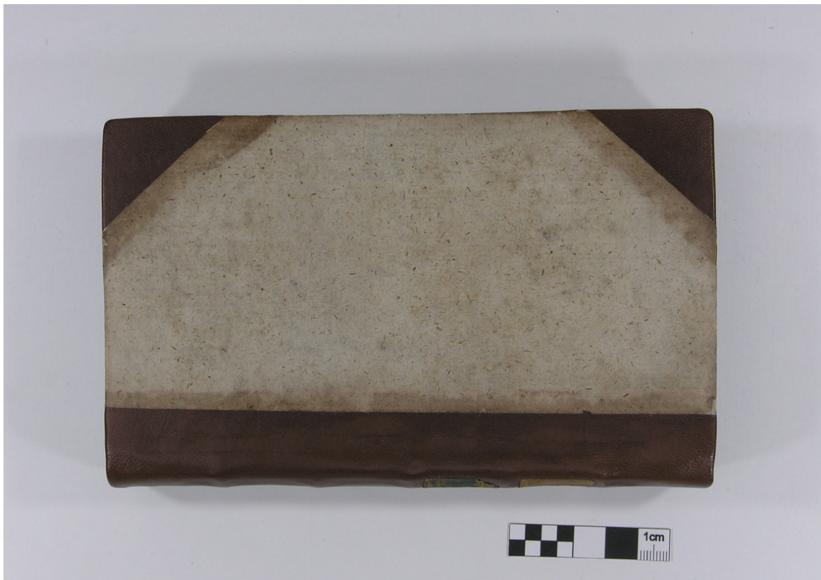
Foto 4: Objekt nach der Restaurierung – hinterer Deckel mit Lederergänzungen