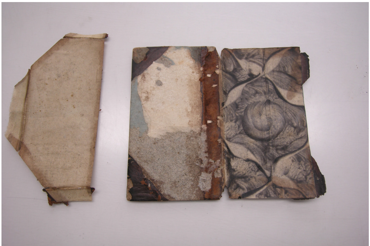
Foto 6: Objekt bei der Restaurierung – – Ablösen Einband Papiere und Spiegel